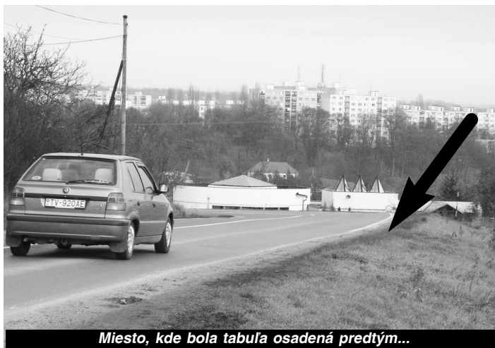
Miesto, kde bola tabuľa osadená predtým...