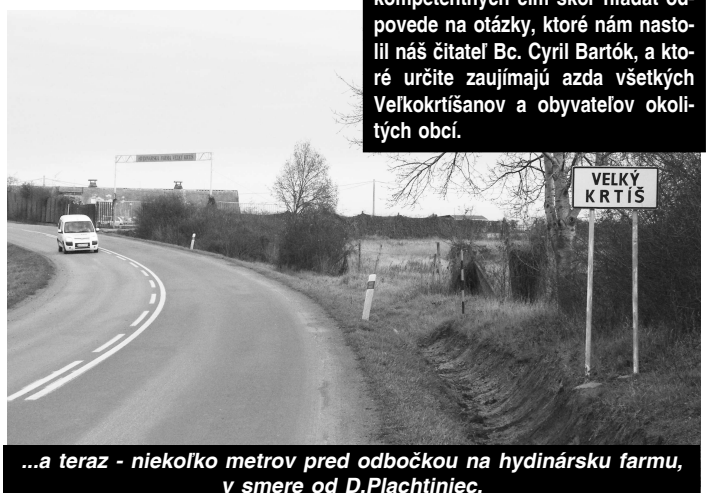
...a teraz - niekoľko metrov pred odbočkou na hydriársku farmu, v smere od D. Plachtiniec.