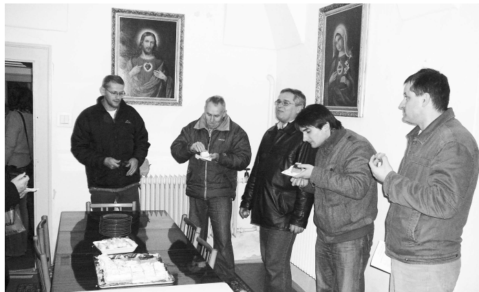
Sklabinská fara asi prvý raz vo svojej 200 ročnej histórii zažila "Deň otvorených dverí", pri ktorom nemohlo samozrejme chýbať pohostenie.