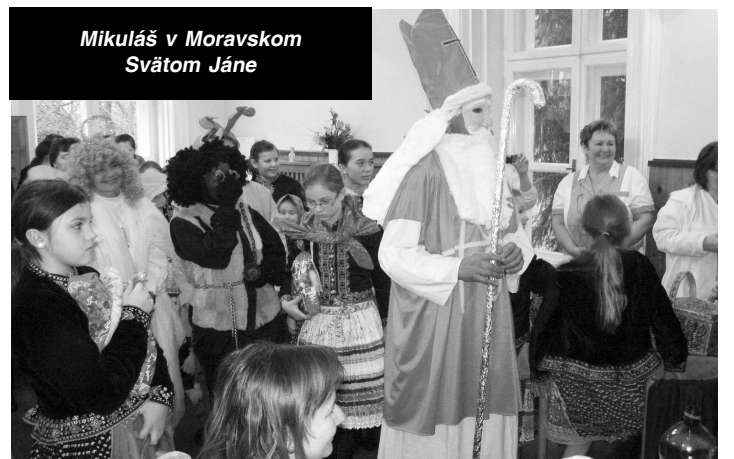
Mikuláš v Moravskom Svätom Jáne