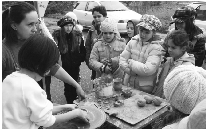
Deti boli fascinované prácou hrnčiariky...

Kultúrny spolok Victoria, okrem príležitostného predstavenia tra-