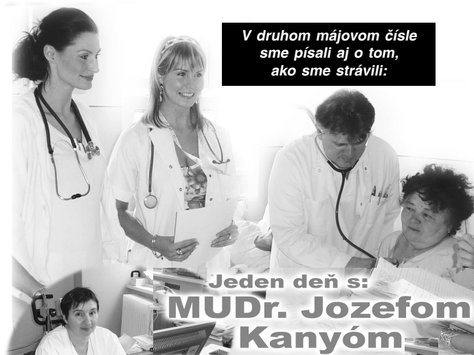
V druhom májovom čísle sme písali aj o tom, ako sme strávili: