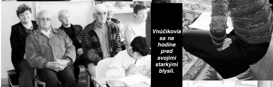
Vnúčikovia sa na hodine pred svojimi starými blysi.

časťnili jednej vyučovacej hodiny, aby videli, ako sa dnes vyučuje, a čo všetko sa učíme. Po skončení hodiny sa ich žiaci povypytovali, ako to bolo za ich mladých čias, keď oni chodili do školy, čo všetko sa odvtedy zmenilo. Pozreli si staré fotoalbymy zapožičané z Obecného úradu v Dolných Plachtinciach a zaspomínali. Po prehliadke interiéru školy mala každá trieda pripravený krátky kultúrny program, ktorým