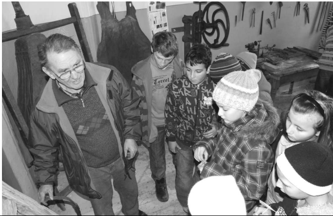
S nadšením si však pozreli aj ukážky iných remesiel

tohto podujatia sme získali prostredníctvom úspešných projektov: „Pôvodné naše želovské remeslá“ – ktorý bol podporený z Ministerstva kultúry SR, programu Kultúra národnostných menšín 2009. Taktiež to bol projekt s názvom „Remeslami k upevňovaniu a zachovaniu zručností a tradícií“ podporený zo zdrojov BBSK. - ag-