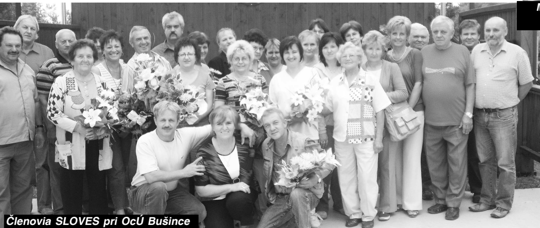
Členovia SLOVES pri OcÚ Bušince

boli dôležité nielen pre jubilantov, ale aj pre tých, ktorí ich pripravovali, pretože sa spoločne pristavili pri dôležitých medzníkoch života, v pamäti zalistovali v mladosti. Vďaka takýmto sviatočným dňom, akým bol aj 11. november v obradnej miestnosti SD v Bušinciach, akoby sa na chvíľku zabudlo na starosti všedných dní. Aj touto cestou im všetkým patrí srdečné blahoželanie, veľa zdravia, lásky, šťastia, pokoja a pohody v kruhu svojich rodín, na pracoviskách a v našej obci.