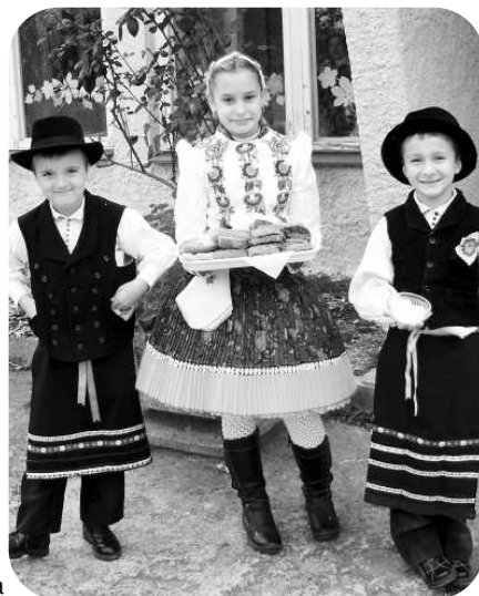
Pred bránami školy vítali žiaci starých rodičov vlastnoručne upečeným chlebom a soľou