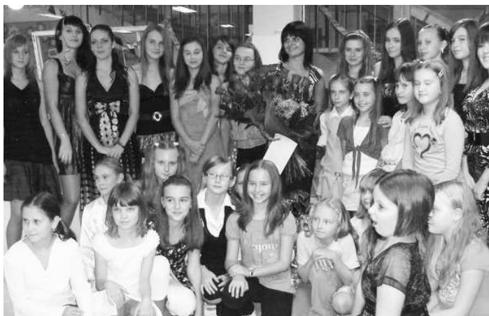
Mažoretky - Plamienky v civile. Takto sa stretli na slávnostnom podujatí pri príležitosti 10 rokov svojej existencie.