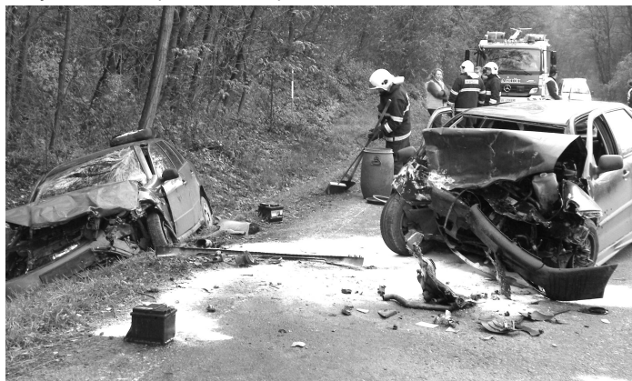
V čísle 49 sme písali aj o dopravnej nehode, pri ktorej sa zranilo až sedem ľudí