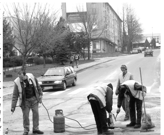
Opravy od výtlkov sa dočkala aj cesta na SNP

obyvatelia mesta vedia o výtlkoch, ktoré nutne potrebujú opravu, môžu to nahlásiť na odbore investičnom a životného prostredia, na tel. č. 4812 123 počas pracovných dní." -red-