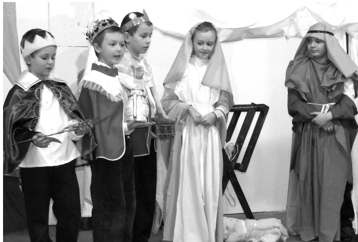
Členovia divadelného krúžku CVČ v Príbelciach sa predstavili tradičnou vianočnou scénkou