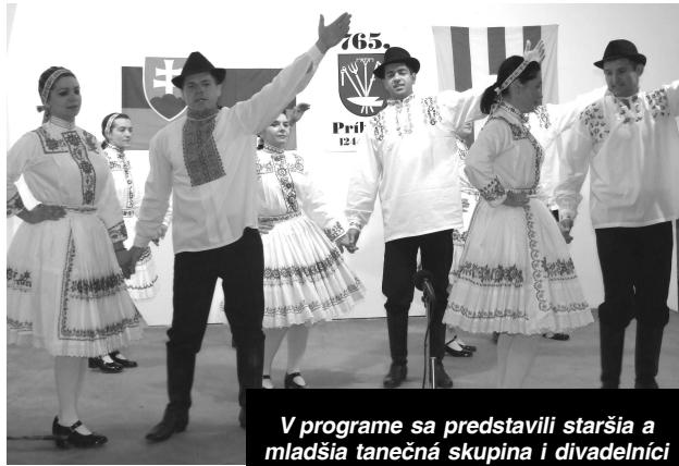
V programe sa predstavili staršia a mladšia tanečná skupina i divadelníci

Veru je to tak, ako spievajú na konci piesne naši priatelia. "Od Dunaja širokého až po Kriváň visokí, ninto kraja krásnejšieho, čo prejdeš svet širokí." - Text: Š. SELSKÁ, foto archív obce -