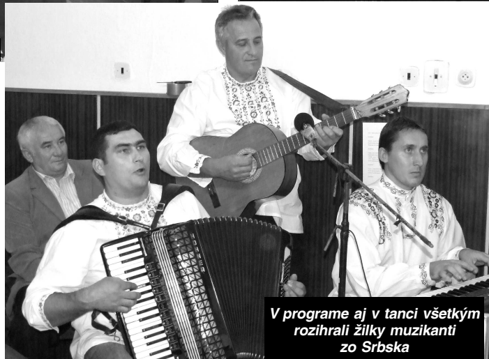
V programe aj v tanci všetkým rozihrali žilky muzikanti zo Srbska