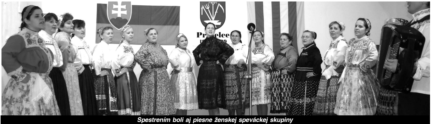
Spestrením boli aj piesne ženskej speváckej skupiny

Pracujúcich a školákov budú určite zaujímať nasledujúce riadky, v ktorých sa dozvedia