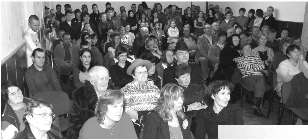
Pestrému programu tleskala preplnená sála príbelského kultúrneho domu.