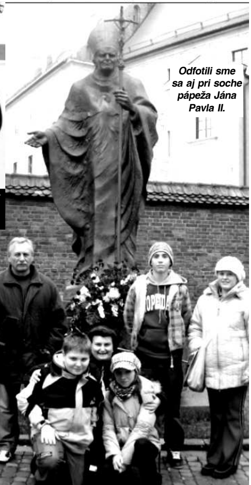
Odfotili sme sa aj pri soche pápeža Jána Pavla II.