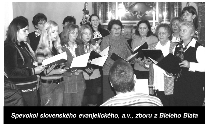
Spevokol slovenského evanjelického, a.v., zboru z Bieleho Blata