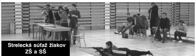
Strelecká súťaž žiakov ZŠ a SŠ

žieranie a sádkovníctvo. V odbore životné prostredie napr. z odborných predmetov stresové faktory v krajine, biotické a abiotické zložky krajiny, základy ekológie, základy monitoringu životného prostredia, stavby v životnom prostredí a pod. V multifunkčných učebniach prebieha napr. výuka predmetu sadovnícka tvorba, sadovnícka projekcia a prax, kde za pomoci počítačov zhotovujú návrhy projektov sadovníckych úprav a následne podľa nich ich realizujú v praxi. Prax a odborný výcvik sa realizuje na odborných pracoviskách, resp. na zmluvne zabezpečených pracoviskách. Odbornosť vyučovania vhodne doplníme účasťou študentov na rôznych odborných výstavách, exkurziách vo výrobných firmách, stážami na zahraničnej praxi, usporiadaním záhradníckych výstav, ako i účasťou na súťažiach odborných