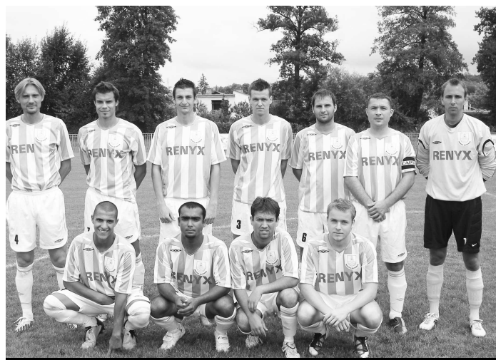
Futbalisti z Dudinc sa tešili z bronzu