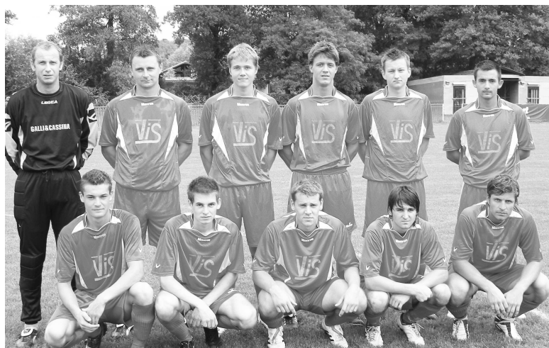
Domáci Prameň bol smutným finalistom.