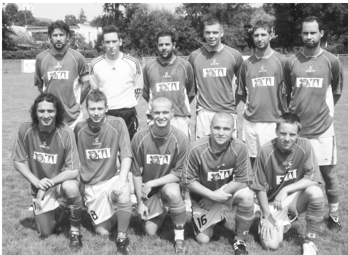
Fomat Martin je novým klubom, ktorý sa do 33 - ročnej histórie turnaja zapísal ako jeho víťaz