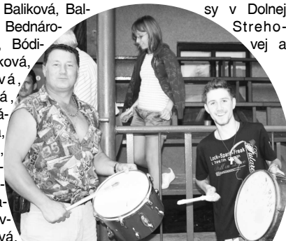
Skalní fanúšikovia klubu si pomaly pripravujú bubny i hlasivky na povzbudzovanie na krajskej úrovni