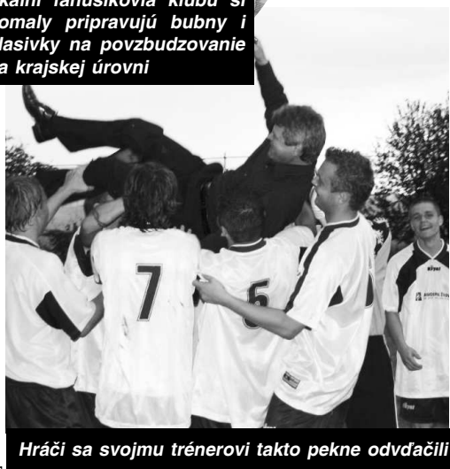
Hráči sa svojmu trénerovi takto pekne odvdali

Vo futbalovom klube sme tahali za jeden koniec povrazu a riadili sa nasledujúcim heslami "Spojme sa všetci pre záhorský futbal" a dokážme pravdivosť slov hesla : "V jednote je sila."