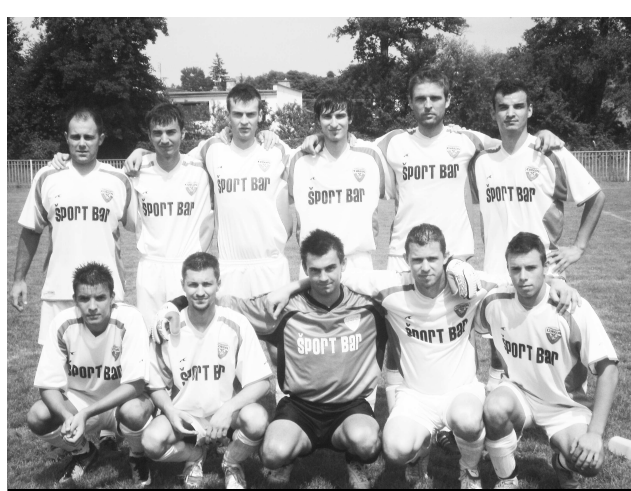
Poslední, ale spokojní Detvanci