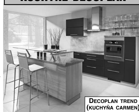
DECOPLAN TREND (KUCHYŇA CARMEN)