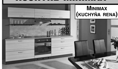
MINIMAX (KUCHYŇA RENA)