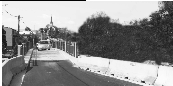
Autám v súčasnosti slúži nový most, ktorý postavili hneď vedľa toho starého. V budúcnosti by mal ostať len pre chodcov. Nájdite však na týchto fotografiách jeden rozdiel. Áno, aj takto môže vyzeráť najhorší scenár, ako na fotografii vpravo. V prípade, ak dolnoplachtinský most neodolá odtrhovým skúškam. Dolnoplachtinčania však veria, že sa most v tejto podobe, v akej ich je v rámci republiky len niekoľko, podarí zachrániť.