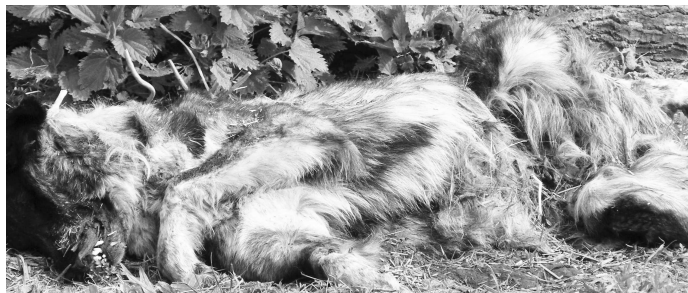
Horor na dvore M.Gondovej - mŕtvy pes - a dôkazový materiál - kvantum hydiny v značnom štádiu rozkladu, na ktorej sa hmýria červy

ny uhynutej hydiny ako dôkaz svojho tvrdenia. Niekoľko týždňové zdochlina hydiny v rôznom stupni rozkladu sa pred nami kopia a vzduch začína zamorovať zápach