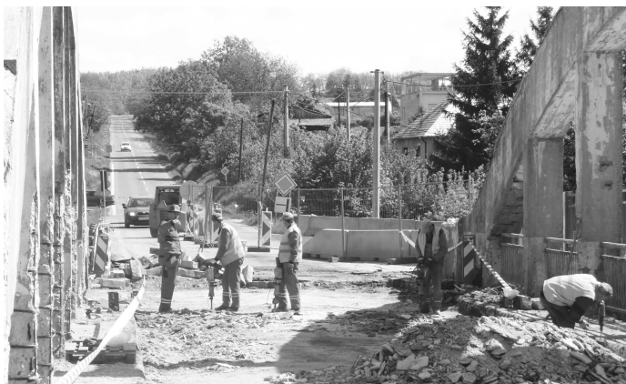
Pracovníci so zbijačkami - zatiaľ nič nenasvedčuje tomu, že by sa starý most nemal rekonštruovať. Stredom starého mosta by ešte v blízkej budúcnosti mali vybudovať akýsi "lešenársky tunel", ktorý bude určený pre chodcov, keďže nový most nie je pre tento účel bezpečný.