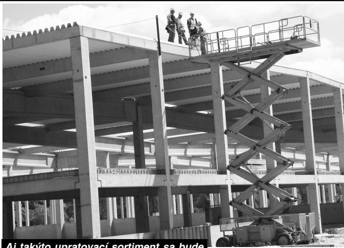
Aj takýto upratovací sortiment sa bude vyrábať v novej hale, ktorá pri Novej Vsi rastie ako z vody

Na školenie do Belgicka by malo ísť 5 mužov, ktorí uspeli vo vý-