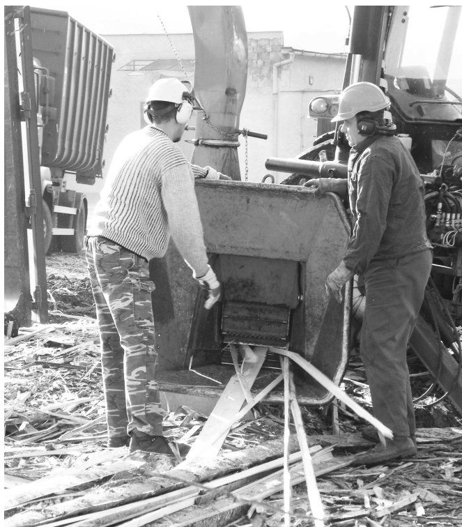
Výroba drevnej štiepky patrí medzi hlavné činnosti Veľkokrtíšskeho sociálneho podniku