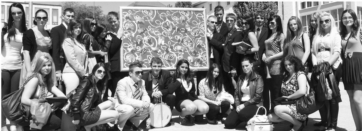
Ak sa absolventi stredných škôl rozhodnú nepokračovať v štúdiu na vysokej škole a zaevidujú sa na úrade práce, s dávkou v nezamestnanosti počítať nemôžu. Na fotografii maturanti zo Spojenej školy v M. Kamení, Obchodná akadémia 4.A.