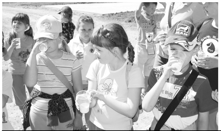
Po takejto prehliadke chutilo mlieko deťom ešte viac ako inokedy