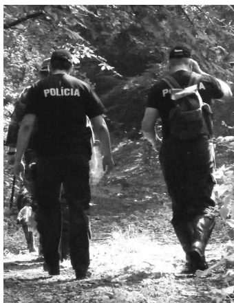
Policajti vo štvrtok 9.6.2011 prečesávali okolie V.Krtíša