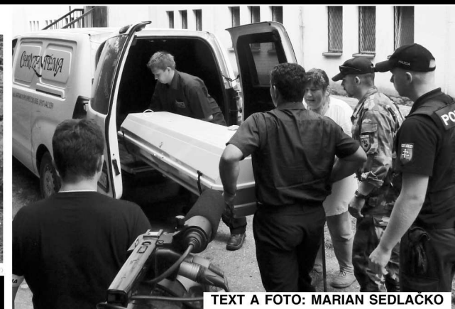
TEXT A FOTO: MARIAN SEDLAČKO