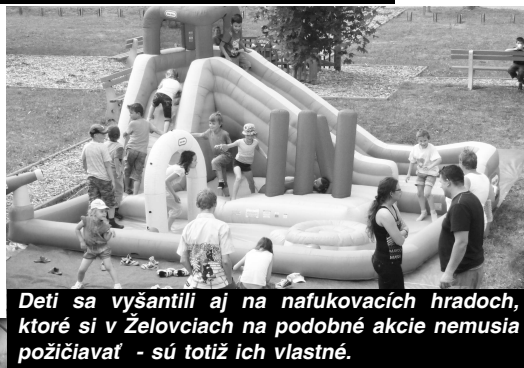
Deti sa vyšantili aj na nafukovacích hradoch, ktoré si v Želovciach na podobné akcie nemusia požičiavať - sú totiž ich vlastné.