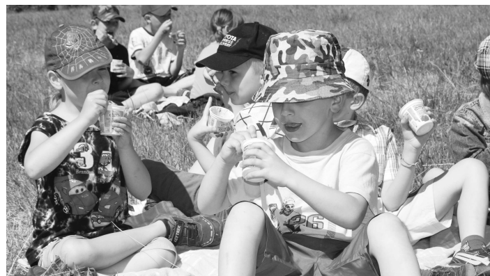
Od sponzora akcie - Zvolenskej mliekarnie - deti dostali jogurty

● Patríte medzi málo podnikov, ktoré sa ešte stále venujú živočiš-