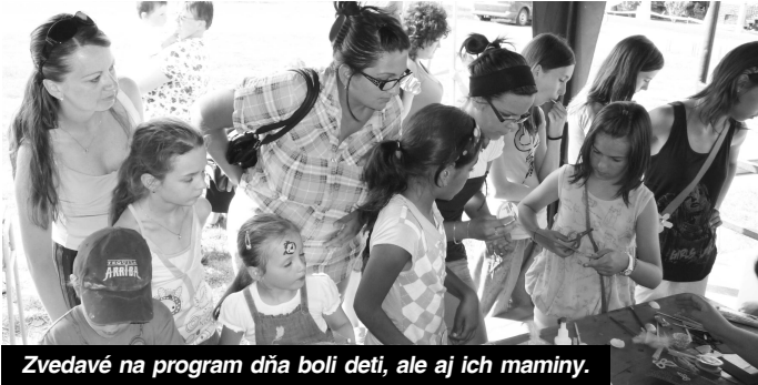
Zvedavé na program dňa boli deti, ale aj ich maminy.