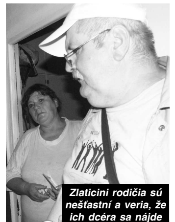
Zlaticiní rodičia sú nešťastní a veria, že ich dcéra sa nájde