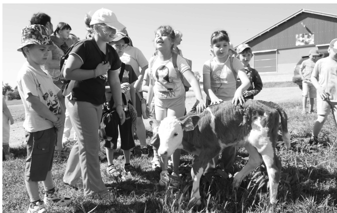
Deti si pozreli novú maštal' i dojnice vo voľnom ustajnení. Páčilo sa im aj toto príutlné teliatko

O zmysle tejto akcie sa presvedčili pedagógovia, rodičia i samotné deti, ktoré si z tohto dňa odniesli veľa zaujímavých a potrebných informácií aj zážitkov.