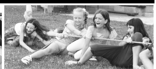
Všetci pri súťažení podávali oduševnený výkon.