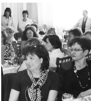
Hostom i pedagógom školy sa slávnostný program páčil