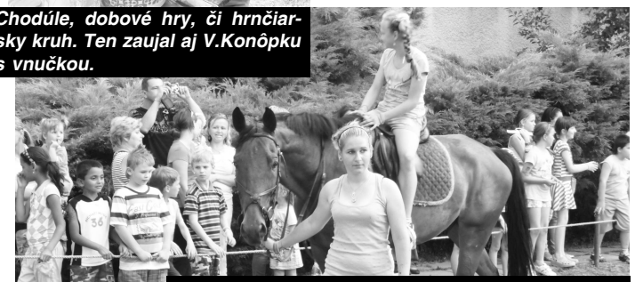
Živé zvieratá patria na každom detskom podujatí k veľmi atraktívnym. Inak tomu nebolo ani v Želovciach, kde sa deti mohli povoziť na koníkoch.