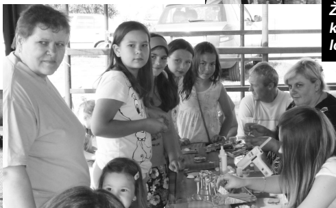
V tvorivých dielňach sa detské rúčky premieňali na ruky umelcov a výtvarných majstrov.