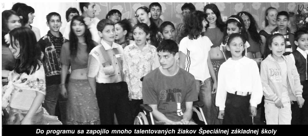
Do programu sa zapojilo mnoho talentovaných žiakov Špeciálnej základnej školy

Kým v školskom roku 1990/91 škola začínala so 16 žiakmi, už o päť rokov to bola takmer stovka a tento počet žiakov, ktorí potrebujú špeciálny prístup pedagógov a vychovávateľov, sa drží dodnes. Oslavy dvadsiateho výročia vzniku Špeciálnej základnej školy vo Veľkom Krtíši boli vhodnou príležitosťou pozrieť sa späť na obdobie, ktorým škola prešla, pozrieť si, čo jej žiaci pod skúseným dohľadom svojich učiteľov dokážu, ale tiež na vytýčenie ďalšieho smerovania školy, ktorá stále bude mať svoje opodstatnenie. -MB - rh-