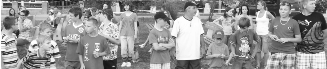
Tu ešte chalani bokom od pódia váhali, či sa pustiť do tanca s babami, nakoniec zlomili diskorytmy aj ich.