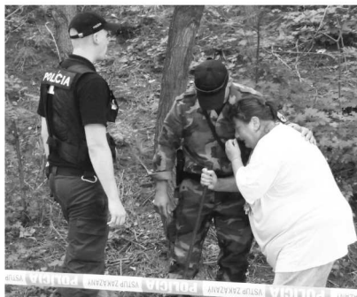
Nešťastnú matku museli upokojovať aj policajti, ktorí zabezpečovali okolie.