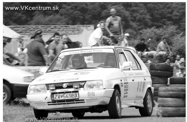
Nedeľné rally jazdy, AMK VK, Opava 5. jún. 2011