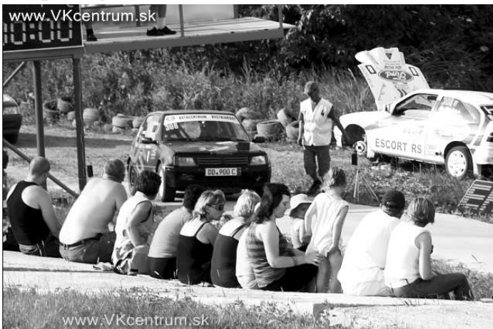
Podvečerné HRC rally, V.Zlievce, 4. jún 2011