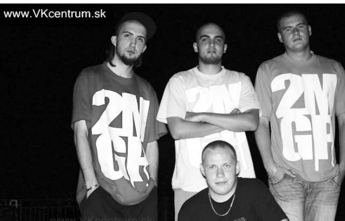
Hip - hop párty a koncert skupiny 2MGP, Bar u Peťa, Stredné Plachtince, 5.6. 2011