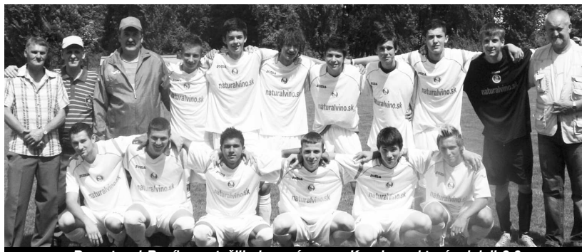
Dorastenci Baníka sa tešili aj po zápase s Krupinou, ktorú zdolali 2:0

V tabuľke nie je započítané kolo z 12.6.2011