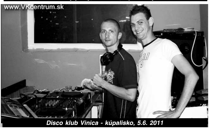
Disco klub Vinica - kúpalisko, 5.6. 2011

Viac fotografií z týchto podujatí nájdete na www.VKcentrum.sk