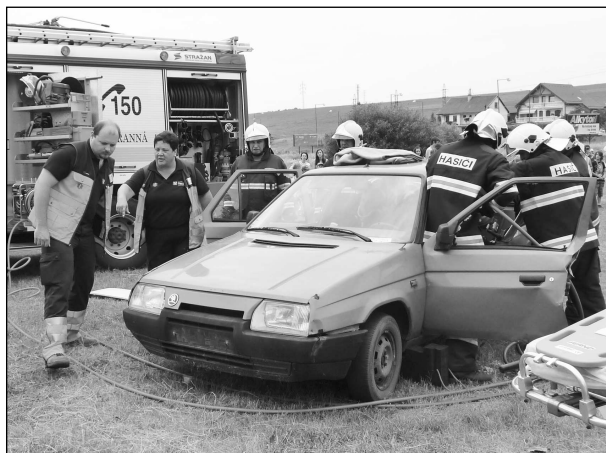
Aj takto môže vyzeráť zásah záchranárov a hasičov pri vyprošťovaní ľudí z havarovaného auta.