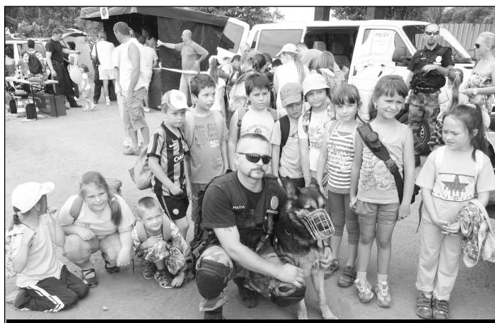
Pracovníci skupiny služobnej kynológie a hlavne ich štvornohí pomocníci boli centrom pozornosti všetkých detí.