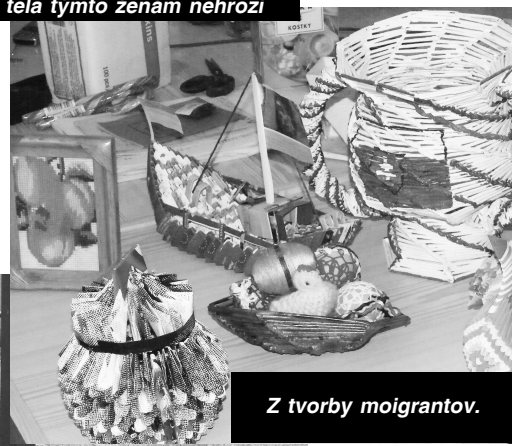
Z tvorby migrantov.

zdravie a životy ich vyhnal do sveta. V Opatovskej N. Vsi ostala so svojim najmladším synom Arom, ktorý má 14 rokov. Ten navštevuje školu v Nenenciach a je nádejným futbalistom. Futbal hráva i súťažne za dorast Opatovskej N. Vsi. A ako hovorí, na Slovensku sa mu páči a najviac ho baví šport, hlavne futbal