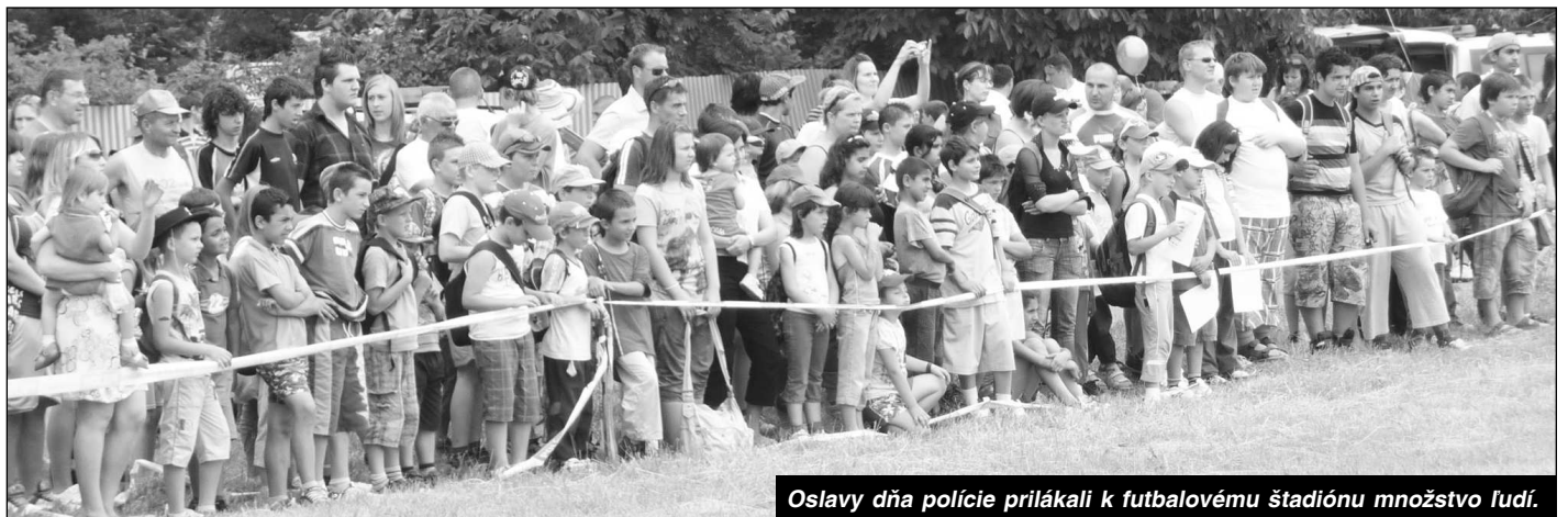
Oslavy dňa polície prilákali k futbalovému štadiónu množstvo ľudí.