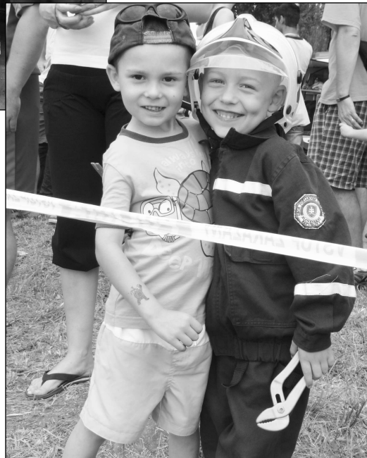
"Aj my raz budeme hasičmi", povedali si možno títo chlapi na fotografii.

Zbrane všeobecne viac zaujímajú mužskú časť populácie, a nebolo tomu inak ani na tomto podujatí. Rešpekt vzbudzovala pištoľ vzor 62 aj samopal vzor 58. Odbor poriadkovej polície OR PZ V. Krtíši ukázal prítomným veci, s ktorými by sa málokto rád v reá-