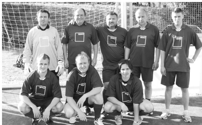
Vítazné mužstvo SDKÚ