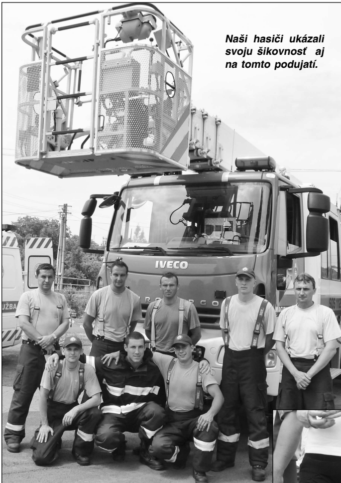
Naši hasiči ukázali svoju šikovnosť aj na tomto podujatí.

le stretol - putá, obušok, spútavací pás, szotvorné prostriedky, zastavovací pás a terč. Vodičov zaujal elektronický merač alkoholu v dychu, pred ktorým niektorí vodiči majú oprávnené obavy. Boli tu tiež prostriedky chrániace policajtov - ochranný odev policajta poriadkovej jednotky, tzv., "korytnačka", či nepriestrelné a reflexné vesty. Pracovníci z odboru kriminálnej polície OR PZ V. Krtíši sa popýšili služobným vozidlom zn. VW Multivan a ukázali aj kriminalistické kufríky používané pri zaisťovaní stôp.