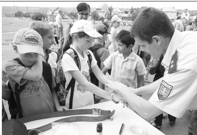
Putá na rukách a branie odtlačkov prstov - to mohli doteraz vidieť deti len vo filmoch.