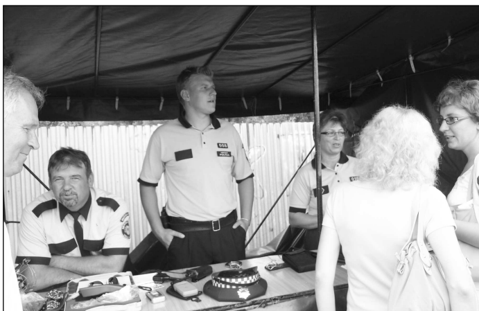
Svoje stanovište mala aj Mestská polícia vo V. Krtíši.