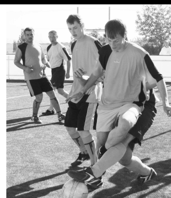
Okresná politická špička hrala v duchu fair - play, aj keď nekompromisne