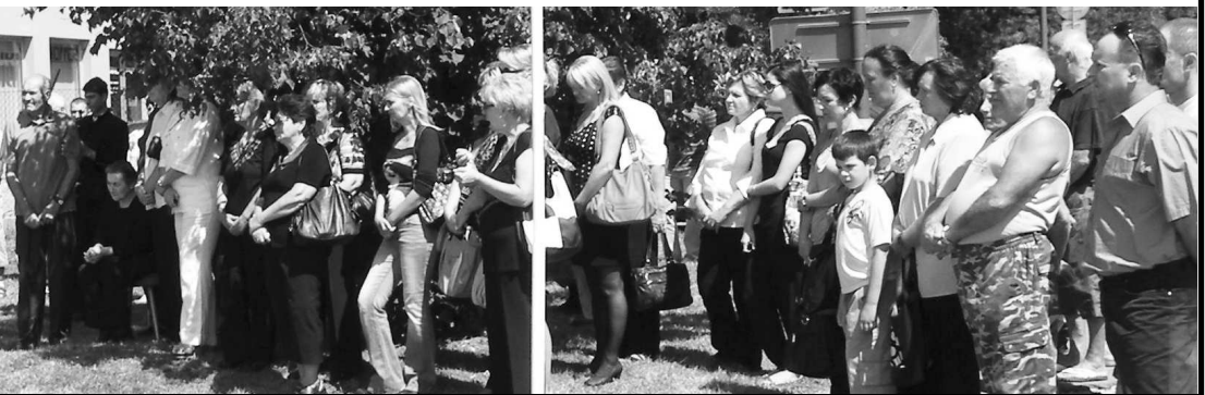
Najbližší príbuzní si prišli uctiť pamiatku svojich blízkych.