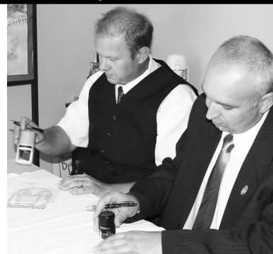
Ešte pečiatka a zmluvy sú uzavreté