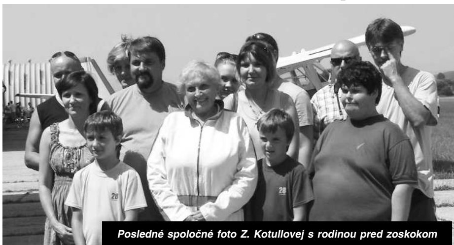
Posledné spoločné foto Z. Kotullovej s rodinou pred zoskokom