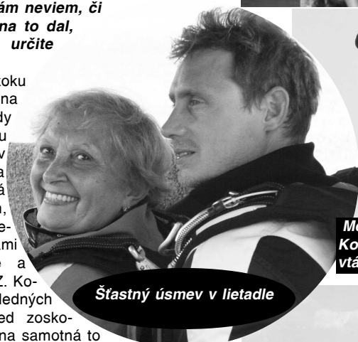
Šťastný úsmev v lietadle