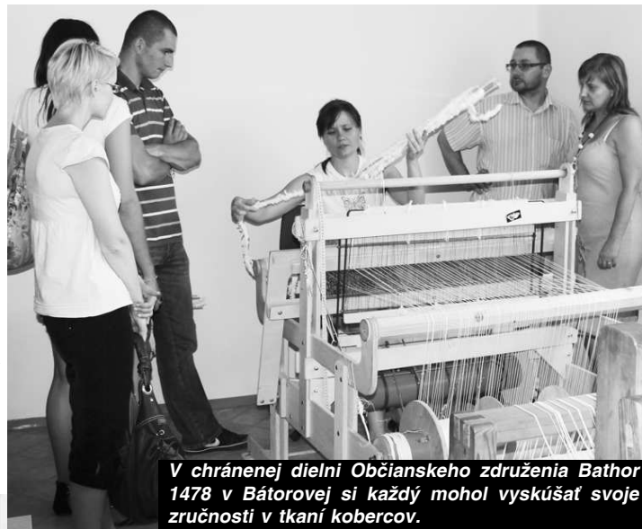
V chránenej dielni Občianskeho združenia Bathor 1478 v Bátorovej si každý mohol vyskúšať svoje zručnosti v tkaní kobercov.

tyška, vzdelávacie centrum zamerané na výchovu osôb s mentálnym postihnutím z portugalského mesta Mira Sintra, kultúrna organizácia Vicenza-i Terra Del Palladio E Del Vicentino z Talianska a spoločnosť zameraná na ochranu prírody Greenworks Nasze Karpaty z poľského regiónu Labowa. Úvodné podujatie projektu sa realizovalo koncom marca 2011, keď sa všetci projektoví partneri stretli v rámci akcie I. Medzinárodného okrúhleho stola v maďarskom meste Balassagyarmat. K rokovaniu za okrúhlym stolom na území Slovenska došlo 14. júla 2011 za účasti predstaviteľov mimovládnych organizácií z oblasti vzdelávania, zachovania kultúrne-