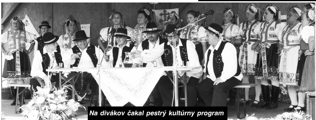
Na divákov čakal pestrý kultúrny program