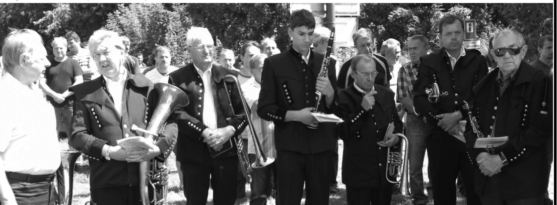
Banícka dychovka zahrala na záver hymnu "Zdar boh, hore!"