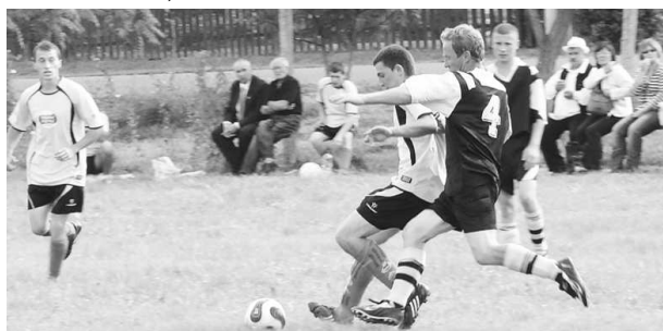
Súbežne s kultúrnym programom sa konal futbalový zápas medzi domácimi a mužstvom z Nógrádsipeku.