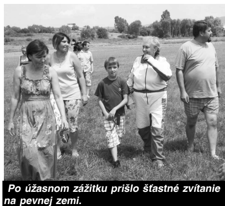
Po úžasnom zážitku prišlo šťastné zvítanie na pevnej zemi.