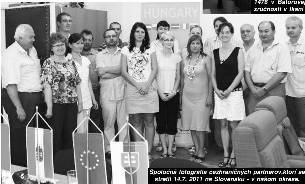
Spoločná fotografia cezhraničných partnerov, ktorí sa stretli 14.7. 2011 na Slovensku - v našom okrese.