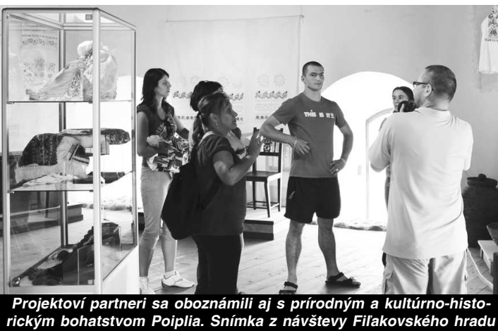
Projektoví partneri sa oboznámili aj s prírodným a kultúrno-historickým bohatstvom Poiplia. Snímka z návštevy Filakovského hradu

vštili sme Kiarovský močiar, Archeologický park v Ipolytarnóci, Filakovský hrad, kamenný vodopád a hrad v Šomoške, ako súčasť Novohradského Geoparku. Účastníci exkurzie sa priamo na mieste realizácie mohli oboznámiť s realizovanými a plánovanými rozvojovými projektmi. Partneri z Labovej veľmi vítali prenos našich skúseností pri príprave výstavby mostov cez rieku Ipeľ, lebo už takmer 12 rokov pripravujú podobnú aktivitu na slovensko-poľskej hranici. Takisto považovali za veľmi významný projekt vybudovanie arboréta pri meste Balassagyarmat, ktoré bude pre návštevníkov sprístupnené ešte len na jeseň tohto roka, ale vďaka našim cezhraničným partnerom Ipoly Erdő z MR sme dostali možnosť prezrieť si túto vzácnu zbierku rastlín aj pred jeho oficiálnym odovzdaním. Predstavili sme naše projekty v rámci cezhraničnej spolupráce HUSK, ktoré sa začnú realizovať ešte v priebehu tohto roka so zámerom vytvorenia cezhraničného poľovníckeho a lesníckeho klastra a na prípravu komplexných protipovodňových opatrení Poiplia.