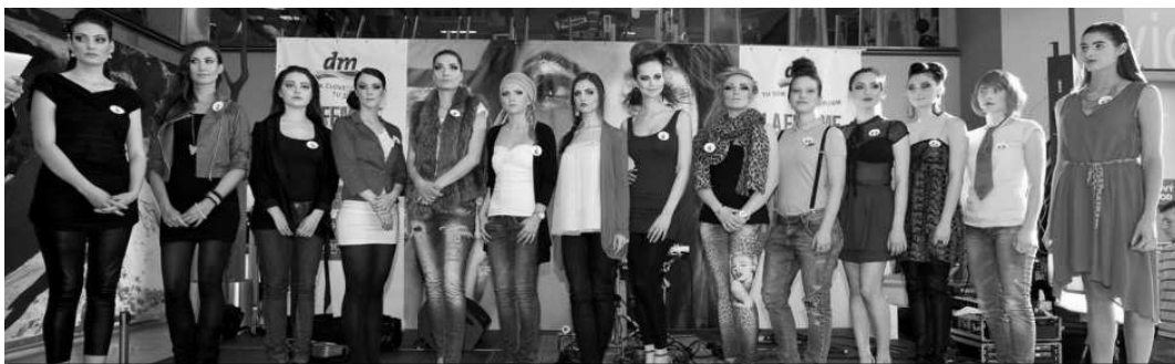
Už postup medzi finálovú štrnásťku bol úspech