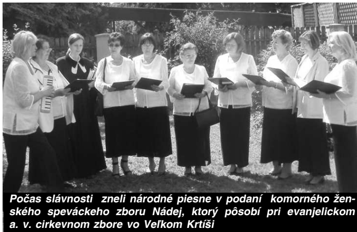
Počas slávnosti zneli národné piesne v podaní komorného ženského speváckeho zboru Nádej, ktorý pôsobí pri evanjelickom a. v. cirkevnom zbore vo Veľkom Krtíši

záver slávnostných služieb Božích, ktoré boli pripomenutím 120. výročia od smrti A. H. Škultétyho (21. mája 1892 v Kraskove) znela v jeho rodisku pieseň taká symbolická pre celú generáciu národných buditeľov "Hojže, Bože, jak to bolí". Po nich pokračovalo slávnostné zhromaždenie pri pamätnej tabuli