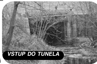
VSTUP DO TUNELA

Približne 1 km severne od obce Dolné Strháre bola vystavaná hať pre mlyn v obci Dolné Strháre. Mlynským jarkom s využitím vrstevnic sa dosiahla hladina