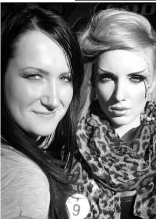
Terézia v plnom sústredení

grafií troch typov mejkapu (svadobný, extravagantný a biznis mejkap na jednej a tej istej modelke) som bola informovaná, že si ma odborná porota vybrala do finálovej štrnástky najlepších prác. Na finále ma sprevádzala sestra, priateľ a samozrejme modelka - moja spolužiačka z vysokej školy. Po príchode som bola prekvapená, že medzi finalistami som bola jediná súťažiaca, ktorá nemá v tomto sme-