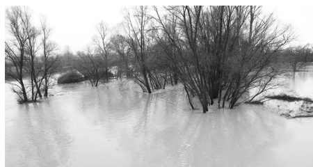
Ipeľ sa rozlial aj pod mostom Katalin na slovensko-maďarskej hranici