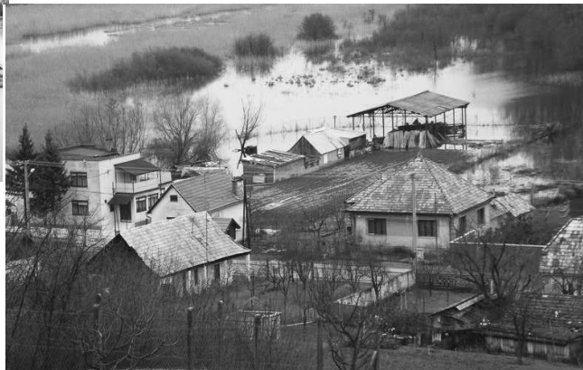
V Kiarove sa na kulmináciu Iplí pripravovali a plnili vrečia pieskom