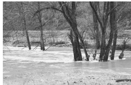
Tisovnický potok sa už nezmesťil pod most a zmenil sa na tri metre hlbokú ríavu