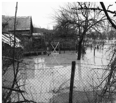
V Muli sa voda dostala do záhrad i pivní rodinných domov