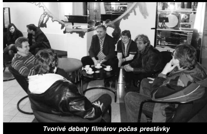
Tvorivé debaty filmárov počas prestávky

facebooku, problematika sexuálnej orientácie a iné), ocenila obrazovú kultivovanosť uvedených dokumentov a reportáží, kvitovala tvorbu pedagógov a detí zo ZŠ Vyhne a Reedukačného centra Čerenčany, ktoré sa venujú animovaným a hraným filmom. Po rozboře nasledovalo vyhlásenie výsledkov, ktoré už všetci zúčastnení netrpezlivo očakávali.