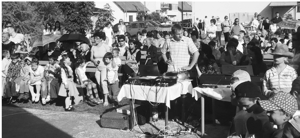
...ktorým bol venovaný aj kultúrny program. V ňom si všetky mamičky s láskou a dojatím pozreli predstavenie tunajších škôlkarov a školákov. Ako je asi všade zvykom, vystúpenie detí sa tešilo veľkému záujmu divákov.