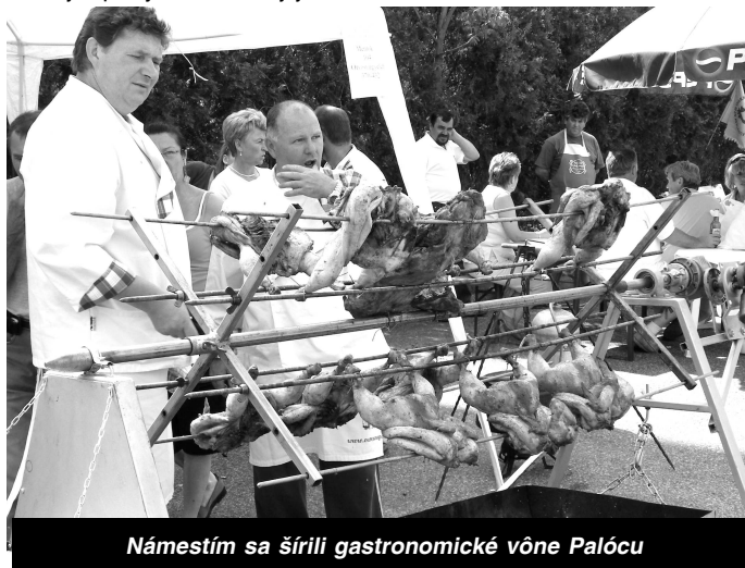
Námestím sa šírili gastronomické vône Palócu