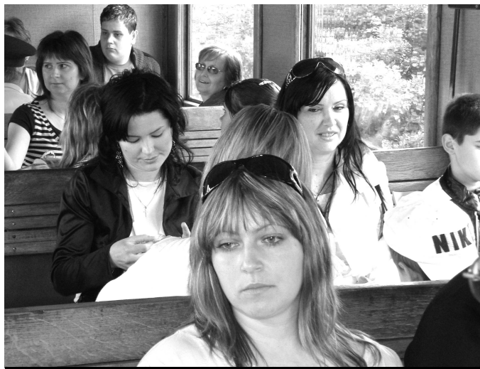
Miesta na sedenie sa zaplnili už vo V. Krtíši

že je to beh na dlhé trate a s realizáciou tohto zámeru počítam minimálne na 10 rokov."