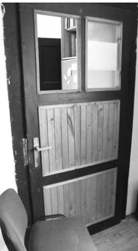
Cez sklenenú výplň dverí sa dostali páchatelia do kancelárie. Na cestu von použili i stoličku.