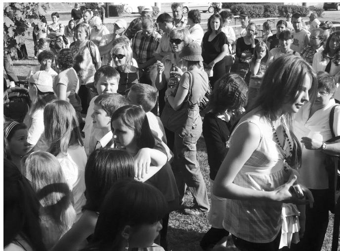
Aj tento rok pripravil obecný úrad v Želovciach podujatie venované všetkým mamám...

pretože významní ľudia, ktorí pre nás v živote niečo znamenajú, nie sú výhercami významných ocenení. Oni sú ale tí, ktorým na nás záleží, ktorí pri nás stoja v dobrom i zlom. Vždy a všade sa sa nich môžeme s dôverou obrátiť a medzi týmito ľuďmi vyniká jeden jediný človek a tým je mama. Všetkým mamám bol venovaný kultúrny program, v ktorom sa predstavili tunajší škôlkari a školáci. Ako je asi všade zvykom, vystúpenie detí sa tešilo veľkému záujmu divákov. Poďakovanie preto patrí učiteľkám za ich trpezlivosť pri nacvičovaní aj za to, že deti sa postupne zbavovali trémy a v takmer hodinovom kultúrnom pásme rôznymi spôsobmi vyznali lásku tým, ktoré im darovali život.