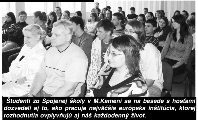
Študenti zo Spojenej školy v M. Kamení sa na besede s hosťami dozvedeli aj to, ako pracuje najväčšia európska inštitúcia, ktorej rozhodnutia ovplyvňujú aj náš každodenný život.

konat voľby do europarlamentu. V prvom volebnom období v ňom pracovali štrnásť europoslanci zo Slovenska. Prijatím ďalších členských štátov sa počet poslancov pre jednotlivé štáty prehodnotil a zmenil, SR bude mať už len 13