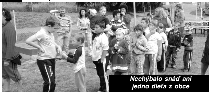
Nechýbalo snáď ani jedno dieťa z obce

la dobrá nálada. Do súťaží sa zapojilo spolu tridsaťdeň detí, ktorým pri súťažení hral dídžeľ z hudobnej skupiny PROJEKT z V. Krtíša." Starosta so svojimi spoluobyvateľmi veľmi dobre vedia, že pozornosť, ktorú dajú deťom, sa rodičom aj obci vráti niekoľkonásobne. V dedinke žije okolo deväťdesiat detí a vždy, keď sa naskytne príležitosť, obec pre ne pripraví nejaké prekvapenie. V tento krásny júnový deň nedostali deti len vecné darčeky, ale najmä lásku, ktorú sa naučia nielen prijímať ale dávať a pozdeshšie odovzdávať svojim potomkom. - edit -