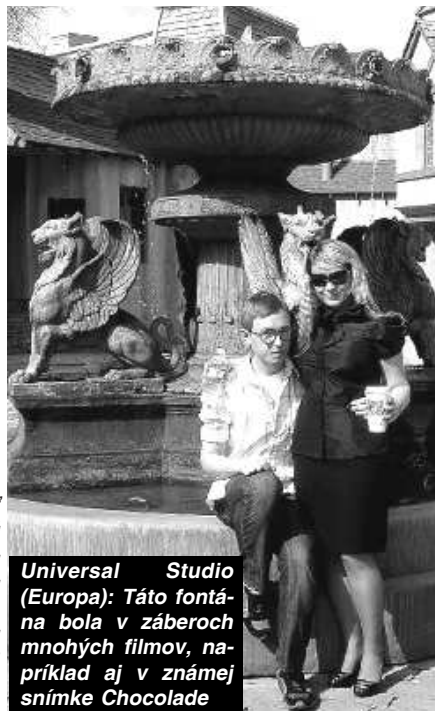
Universal Studio (Europa): Táto fontána bola v záberoch mnohých filmov, napríklad aj v známej snímke Chocolate