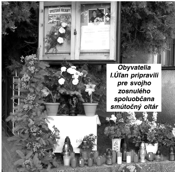
Obyvatelia I.Úľan pripravili pre svojho zosnulého spoluobčana smútočný oltár

17. decembra 2005 Boeing 777 muselo po poruche dvoch motorov núdzovo pristáť v Irkutsku na Sibíri. Lietadlo letelo zo Soulu do Paríža. Nik nebol zranený.