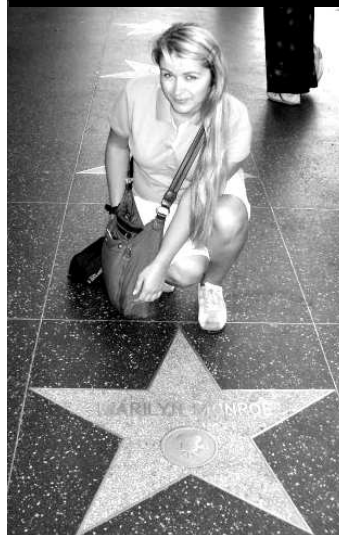
Na chodníku slávy v Hollywoode - pri hviezde patriacej Marilyn Monroe