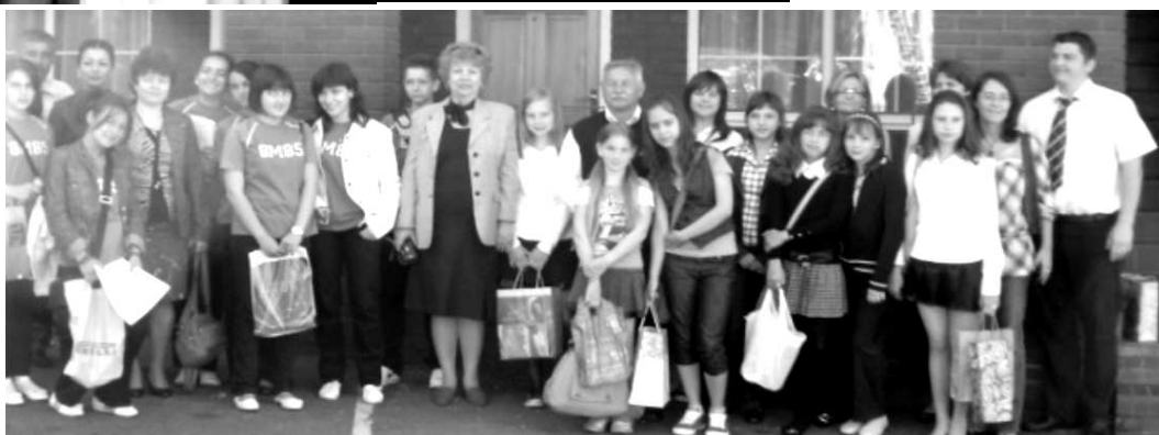
Žiaci a učiteľia v Newcaste Under Lyme