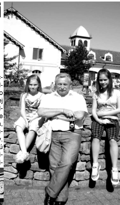
Dievčatá a pán riaditeľ v Alton Towers Theme Park

ketu. V popoludňajších hodinách žiaci zavítali do rodín svojich anglických kamarátov, kde boli nutné komunikovať po anglicky.