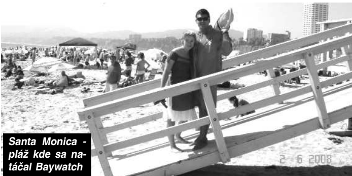
Santa Monica - pláž kde sa natáčal Baywatch

bez zábran, žiť v momente a aktívne počúvať. Uvedomíte si každý svoj pohyb, mimiku, hlas, prejavy správania. Niekedy sa to na obrazovke potom ťažko pozerá (smiech). Najdôležitejšiu vec, ktorú som sa z americkej kinematografie naučila je, že keď hráte, nikdy nesmiete hrať. Musíte to naozaj prežívať, aby to bolo skutočne organické. Toto pravidlo platí vždy, či už robíte komédiu alebo drámu, divadlo či film. Herec sa musí naučiť prežívať skutočné pocity vo vymyslených podmienkach. Mne v tomto veľmi pomáhajú hodiny Meisnerovej techniky".