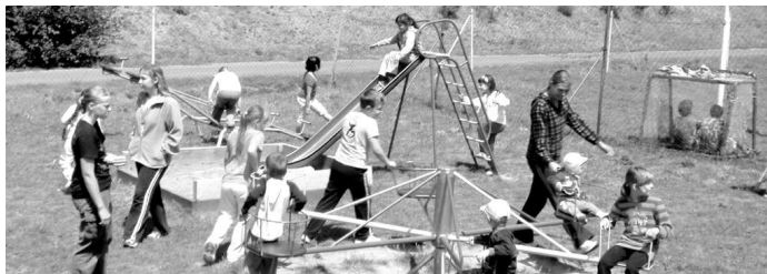
Plný deň súťaží vystriedalo šantenie na peknom zrekonštruovanom detskom ihrisku

ciu: "Deň detí sme určili na 13. júna. Deti spolu s rodičmi sa streli na obecnom - športovom ihrisku. Chlapci a dievčatá, ktorí boli zaradení do troch družstiev, súťažili v ťahaní lanom, kopali loptu na bránu a mohli si vyskúšať koordináciu pohybov pri nosení vajíčok v lyžičkách. Chlapcov zaujala súťaž v behu s loptou medzi kužeľmi a striekaní na terč s malou hasičskou hadicou. Víťazom sa stal ten, kto zho-