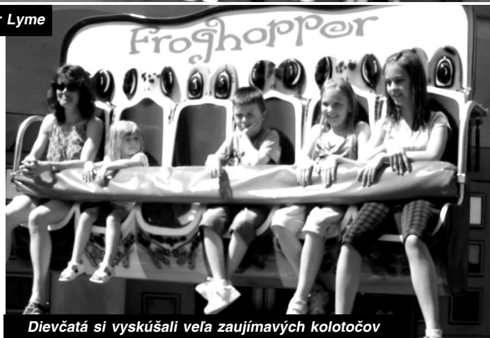
Dievčatá si vyskúšali veľa zaujímavých kolotočov