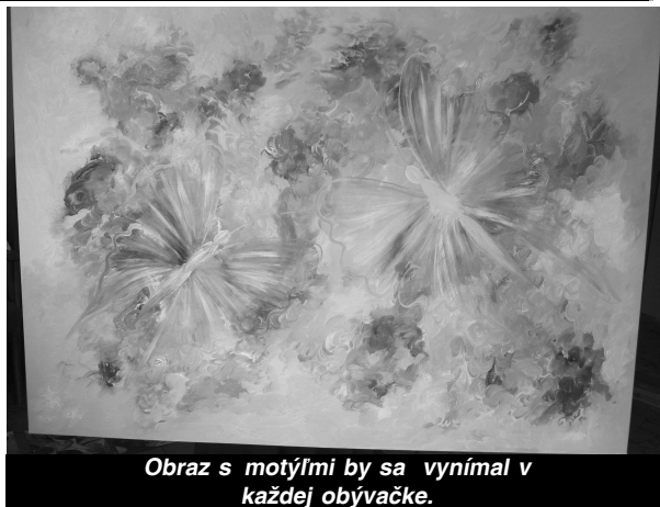
Obraz s motýľmi by sa vynímal v každej obývačke.