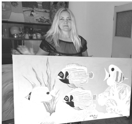
Pri pohľade na tieto obrazy objavíte krásu mora a morských rýb.

Doteraz namaľovala vyše päťdesiat obráz-