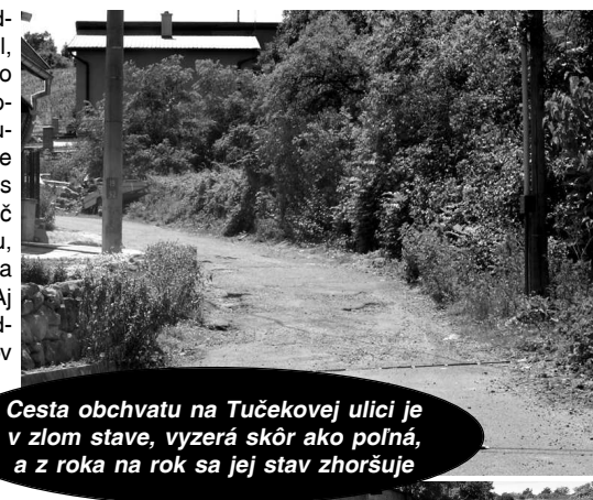
Cesta obchvatu na Tučekovej ulici je v zlom stave, vyzerá skôr ako poľná, a z roka na rok sa jej stav zhoršuje

stačí brať ani odvodňovací kanál, ktorý má zvod do kanalizácie dažďovej vody a je umiestnený tesne pred križovatkou s hlavnou ulicou. Nič nezastaví vodu, ktorá sa valí na hlavnú ulicu. Aj týmto sa pre chodcov a motoristov stáva cesta nebezpečnejšou, navyše je na nej upravená rých-