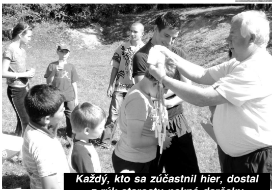
Každý, kto sa zúčastnil hier, dostal z rúk starostu pekné darčeky