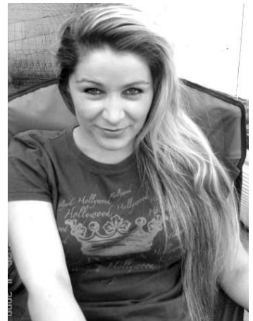
Ambície našej rodáčky sú veľké

"Už od základnej školy som chodila na recitačné a spevácke súťaže. Na strednej škole som založila herecký krúžok, školské rádio a školské noviny na Strednej zdravotnej škole v Lučenci. Tiež som chodila recitovať, uvádzala konfe-