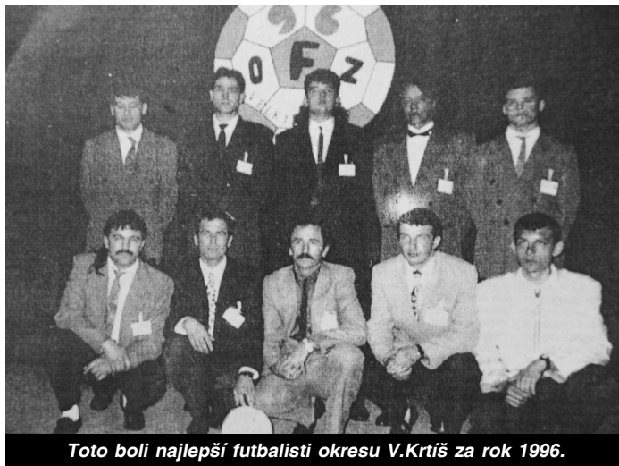
Toto boli najlepší futbalisti okresu V.Krtíš za rok 1996.