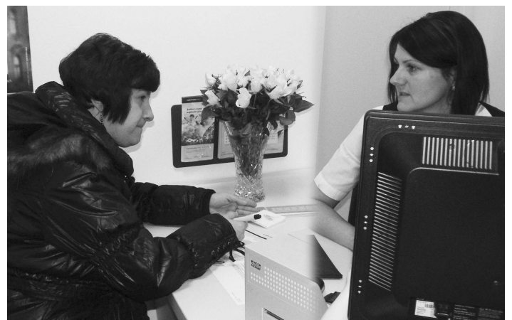
Nové priestory privítali návštevníkov hneď od prvých minút ich otvorenia.

vybavením. Uvedené novinky budú poskytovať našim občanom viac pohodlia a diskretnosti pri využívaní všetkých služieb poskytovaných na pracoviskách Slovenskej pošty a rovnako tak i pri informovaní sa o aktuálnych ponukách Poštovej