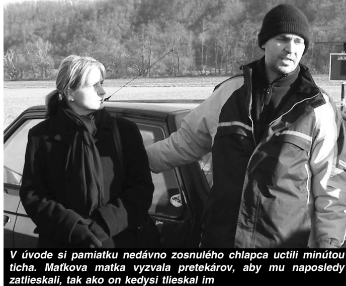
V úvode si pamiatku nedávno zosnulého chlapca uctili minútot ticha. Matkova matka vyzvala pretekárov, aby mu naposledy zatlieskali, tak ako kedysi tliekali im

Matko sa stal veľkým fanúšikom motorizmu a sprevádzal svojho otca na viacerých pretekoch. Bol obľúbený aj medzi ostatnými jazdcami, poznali ho takmer všetci, pretože tak spontánne a s radosťou