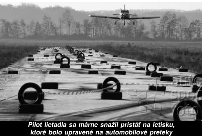
Pilot lietadla sa márne snažil pristáť na letisku, ktoré bolo upravené na automobilové preteky