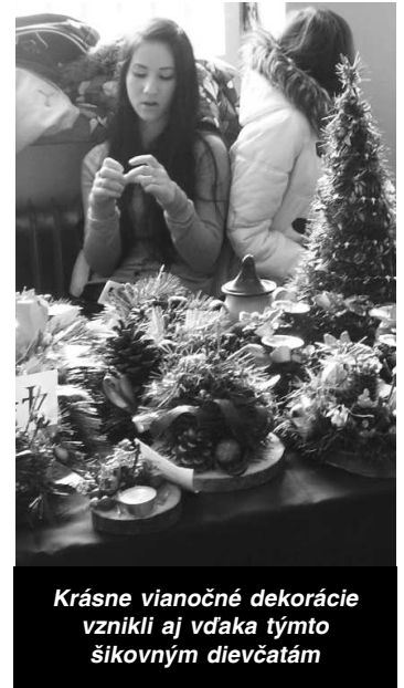
Krásne vianočné dekorácie vznikli aj vďaka týmto šikovným dievčatám