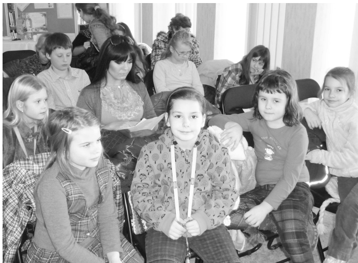
V knižnici sa zišli deti rôznych vekových kategórií, ktoré so záujmom počúvali prednes svojich spolužiakov