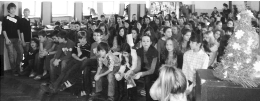
Vianočné trhy majú na škole vždy veľký úspech. Nešlo len o nákupy, čaro Vianoc pripomenulo aj spolupatričnosť a súcit s deťmi, ktoré nemajú možnosť prežiť také sviatky ako my