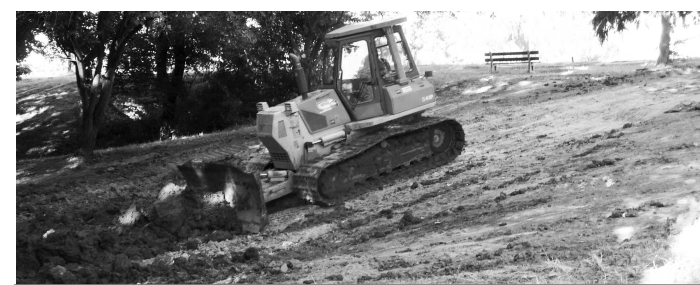
● Nebezpečné strže v parku Hôrka zasypávali zeminou vykopanou pri budovaní obchodného centra