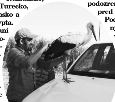
Méneša pri egyptskom Níle prepúšťajú na slobodu

Podobné prípady sú ale takmer každý rok. Známa je informácia o včelárikovi zlatom, ktorý bol odstrelený na Blízkom východe z podozrenia zo špiónáže pred dvomi rokmi.