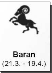
Baran (21.3. - 19.4.)

Nevyčítajte druhým, že vás energeticky lynčujú a ničia. Robia len to, čo im vy sami dovolíte, čiže v závere spaľujete len a iba sami seba. Vaša dynamickosť sa akosi vytratila a vy neviete, ako ju získať späť. Jednou z ciest je sebaopoznanie a prijatie samých seba na všetkých úrovniach a potom sa zapáli aj dávnejšie vyhasnutá fakla. Vo vzťahoch neukazujte príliš svoju osobnostnú veľkosť, pretože pohár trpezlivosti u partnera pretečie a vy môžete zostať na nejaký čas bez partnera. Budete viac pracovne vyťažení, čo pre vás na pracovnej úrovni padne na úrodnú pôdu.