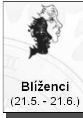
Blíženci (21.5. - 21.6.)

Blíženci, úsmev na perách. Vám sa počas týchto dní bude tak dariť ako už dávno nie. Všetko pôjde presne podľa vášho plánu hladko a doslova ako po masle. Veľa výkonnú za málo námahy, presne tak, využite to. Otvorené máte všetky oblasti, stačí si len pomyslieť a jednoducho ísť si za tým. Uvidíte človeka, ktorý sa vám zapáči? Choďte a oslovte ho. Nemáte prácu? Vyberte si z ponúkaných možností, aj inzerátov, ponuku, ktorá vás osloví najviac a choďte za tým na tutovku. Jedno menšie „ale“ sa však otvára v zdraví a to univerzálne v prepojení na vodu (pitný režim, strach z hlbokých a nepoznaných vôd a pod.).