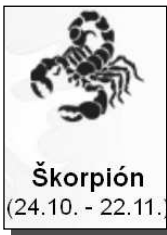
Škorpión (24.10. - 22.11.)

Začínate chápať ako funguje princíp príťahovania si vecí do svojich životov. Budete viac upúšťať od matérie a sveta „podložiteľného“ čistým rozumom a faktami. Zvážda a mámi vás svet všetkého nevyvetliteľného, tajomného a duchovného. Deje sa to preto, lebo prišiel najvyšší čas vnútorne sa obohatiť. Nie je nič zlé na tom, byť sem-tam rojko, vyskúšajte si to a aspoň na ten čas sa budete cítiť slobodnejšími a pokojnejšími. Jedno malé upozornenie tu predsa len máte – nemáte otvárať knihu, ktorá je už dávno zatvorená a platí aj opak, nezatvárajte knihu, pokiaľ si nedáte záložku alebo ju neprečítate.