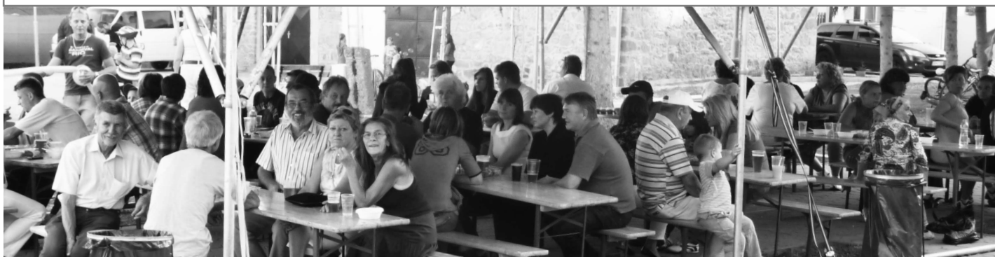
Malokrtíšania sa stretli takmer všetci pod jednou veľkou strechou

starostovania urobil a odovzdal mu Cenu starostu obce Malý Krtíš.