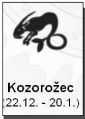
Kozorožec (22.12. - 20.1.)

Aj do týchto dní sa prenášajú záležitosti z minulotýždňového horoskopu. Stále platí pre vás zmena, začiatok a zrod niečoho nového. Pre tento raz však už môžete priamo konať, cesta je čistá a nič vás nedrží v tom, aby ste sa do zmien nepustili, akurát majte pod kontrolou veľké očakávania, tým predídete akémukoľvek sklamaniu. Okrem iného, máte nadelenú hojnosť a plodnosť, ktorá sa vzťahuje aj na fyzickú úroveň. Na povrch bude vyskakovať ego, ktoré by ste čím skôr mali skrotiť a to ešte predtým, než vám čo – to skomplikuje.