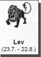
Lev (23.7. - 22.8.)

Pre vaše znamenie platí rozvoj vzťahov. Všade, kde, či už v partnerských, rodinných alebo priateľských vzťahoch škripalo, sa vyjasní. Zalúbení ešte viac prepádnu tomuto citu, nezadaní padnú do osídliel lásky alebo zalúbenosti, zatrpknú si dajú novú šancu. Otvorili ste svoje srdiečka a dávate do okolia signál, že máte chuť žiť a tešiť sa zo všetkého pekného, čo vás čaká, ako aj to, že s nezdarmi a neduhmi, ktoré vám prekrážia cestu, raz dva zatočíte. Vležete do seba chuť napredovať, dýchať a existovať. Očakávajúce rozmanitosť a pestrosť dní.