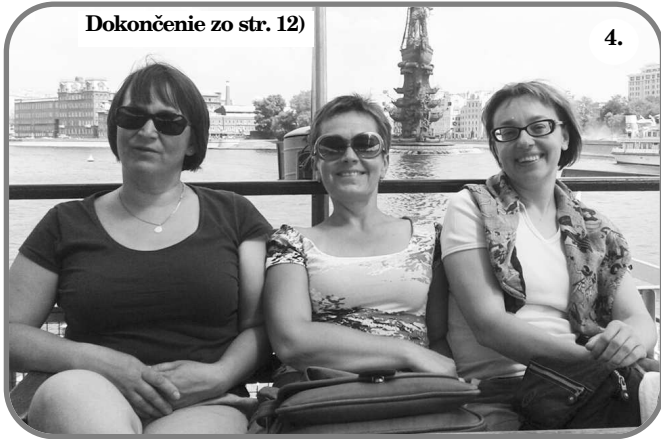
Dokončenie zo str. 12)