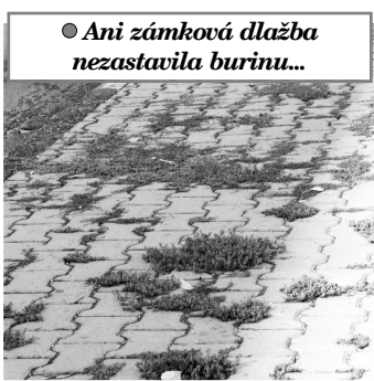
● Ani zámková dlažba nezastavila burinu...