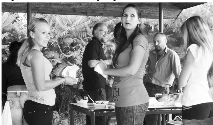
Dobrý guláš chutil mladým i starým a posilnení dobrým jedlom sa zabávali Malokrtíšania až do rána

stavat spoločný dom obradov, zrekonštruovať spoločenské stredisko, vybudovať či opraviť miestne komunikácie, zrealizovať kanalizáciu, rozvod vody i plynu, vybudovať multifunkčné ihrisko s umelou trávou, dokončiť výstavbu 12 nájomných obecných bytov i zrekonštruovať a vystavať v obci chodníky, autobusové zastávky a oddychovú zónu pre deti.