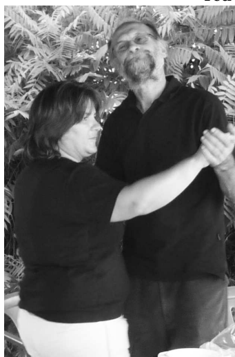
Keď je práca vykonaná, môžu sa zabávať aj kuchári...