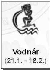
Vodnár (21.1. - 18.2.)

Vety typu: „Urobilo sa to samé“ alebo „Ja o ničom neviem“, prekvapenia a údivy zaobalené v detskej nevinnosti vám pre tieto dni neprejdú. Karta dieťa síce poukazuje na to, aby ste sa viac uvoľnili a veci nebrali príliš vážne, ale myslené to je pre vaše znamenie v rovine súkromia, nie tam, kde si vážnosť situácie vyžaduje sústredenie a nie odľahčovanie. Deti veria v zázraky, ktoré sa v skutočnosti dejú, berte to ako výzvu na to, aby vám boli príkladom a aby ste začali veriť aj vy. Pri vašom znamení (súvislosti neukazuje) sa sústreďte na číslo štyri a naň prepojenú symboliku (štyri – živly, svetové strany, rohy a pod.), spojitosti sa vám samé ukážu a rýchlo ich pochopíte.