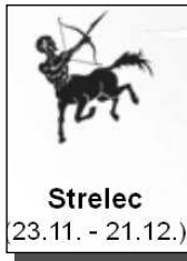
Strelec (23.11. - 21.12.)

Aj do týchto dní sa prenášajú záležitosti z minulotýždňového horoskopu. Stále platí pre vás zmena, začiatok a zrod niečoho nového. Pre tento raz však už môžete priamo konať, cesta je čistá a nič vás nedrží v tom, aby ste sa do zmien nepustili, akurát majte pod kontrolou veľké očakávania, tým predídete akémukoľvek sklamaniu. Okrem iného, máte nadelenú hojnosť a plodnosť, ktorá sa vzťahuje aj na fyzickú úroveň. Na povrch bude vyskakovať ego, ktoré by ste čím skôr mali skrotiť a to ešte predtým, než vám čo – to skomplikuje.