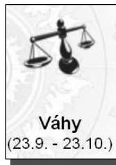
Váhy (23.9. - 23.10.)

Pri váhach sa stále viac ozýva pocit usadiť sa a so svojou rodinou fungovať v stereotype, po ktorom v tomto období priam prahnete. Ste na najlepšej ceste si to do budúcnosti splniť, ale ešte predtým príde a tento týždeň sa odštartuje besné, divoké a niekedy rozumom nevyvetliteľné obdobie plné dynamickosti. Vyšantíte sa dosýta, platí to aj pre tých usadlejších, ktorí budú chcieť pocítiť vzrušenie, energiu a adrenalín. Pre okolie sa vďaka tomu stanete veľmi príťažlivými a chcenými. Ako s tým naložíte, je už len vo vašich rukách.