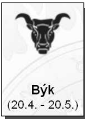
Býk (20.4. - 20.5.)

Mali ste veľké oči, teraz vám zostali iba pre plač. Finančný systém ste absolútne nezvládli, zmieľate sa medzi príjmami a výdavkami s tým, že vám všetko vychádza nahlp. Toto pravidlo a náklonnosť hviezd nemusí pre vás platiť stále, akonáhle prekročíte určité hranice a zatúžite po všetkom, čo sa vám páči, napriek tomu, že to nepotrebujete, bude vám zhora priškrtený finančný tok. Jeho znovuspustenie príde s vašim uvedomením a ubrzdzením. Nabehnite na šetriaci systém. Iné oblasti sú pre vaše znamenie vyvážené a pokojné. Nevlosť, ktorá sa u vás zjaví v strede týždňa, zmierni príroda a zvieratká.