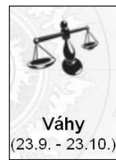
Váhy (23.9. - 23.10.)

Vám bude po tieto dni dopriať hlavne na poli lásky. Užite si flirtovanie a spoznávanie nových ľudí, už dávno ste neboli na výslni tak, ako vám to bude umožnené po tieto dni. Nechajte sa velebíť a ospevovať, nakopne vás to v tom najlepšom slova zmysle. Popri všetkom by ste sa mali viac šetriť a hlavne dbať na rovnomerné rozloženie vašich síl a schopností, aby vám vydali na každý deň z týždňa, nie že si ich miniete hneď na začiatku týždňa. Ak si to správne nerozdelíte, dobehne vás poriadna únava a nechuť čokoľvek robiť. V zdravotnej oblasti si dávajte pozor na prechladnutie od nôh, čo by sa podpísalo pod problémy s močovým mechúrom a celou oblasťou podbrúška.