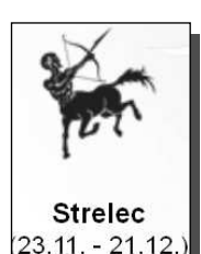
Strelec (23.11. - 21.12.)

Vzdajte sa všetkého nefunkčného a starého. Pretriedte si okruh známych, povyhadzujte zbytočné, nepotrebné veci, ktoré postupne vymeníte za nové. Rozprúďte tým stagnujúcu energiu. Viac vás bude počas týždňa strašiť a mátať pocit strachu a obáv z nezvládania vecí, zo samoty a toho, že sa na „celom“ svete cítite osamelí, ako aj strachu zo straty najbližších (na duchovnej úrovni, čiže strach z odcudzenia, ale aj na fyzickej úrovni). Sú to len myšlienky, ktoré pre vás nie sú typické, tak ich hneď aj zažehnajte, ešte skôr, ako sa vo vás na dlhšiu dobu zahniezdia. Neľnúkajte nad rozliatym mliekom, iba zoberte handru a utrite ho, to je schodnejšia cesta.