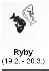
Ryby (19.2. - 20.3.)

Tak, milé ryby, stojte nohami čo najpevnejšie na zemi a pre istotu sa v nej aj nejakým spôsobom ukotvite. Príde totiž „tajfún“, ktorý bude mať len jednu jedinú úlohu a tou je siahnuť a poriadne zatrasenie vašim egom, ktoré sa vám tak trochu vymklo spod kontroly. Ak to ustojíte, padne to len v prospech vás spolu s poučením. Ak náhodou padnete, rátajte s tým, že nejaký čas zostanete nepovošimnuto „ležať“ na zemi s raneným, sebalutujúcim egom a bez poučenia. Tí, ktorí to majú pevne v rukách a vo vyššie uvedených riadkoch, nevidia hrozbu vo venovaní sa po tieto dni prevažne rodinným záležitostiam, ktoré sú naviazané aj na „papierovačky“.