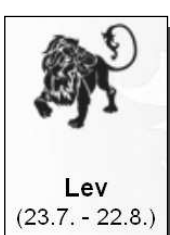
Lev (23.7. - 22.8.)

Premkne vás pocit, že ste v niečom zlyhali, alebo, že ste niečo pokazili, nedajte sa tým zmiast, je to len pocit, všetko je na poriadku. Avšak, viac by vám prospelo, keby ste sa o niečo viac upokojili, fungujete ako myška na kľúčik, ktorý stále treba nanovo natočiť – čiže aj vy sa musíte nejak dobiť a veru, mali by ste to robiť častejšie, lebo budete na nejaký čas úplne vyradení a to predsa nechcete. Neminie vás rodinný konflikt, v ktorom sa budete cítiť ranení a trochu zhodení, nerobte scény, prijmite to, spracujte to a potom takto pekne zabalené to hodte za hlavu a choďte ďalej, bude to len momentálna prechodná záležitosť.