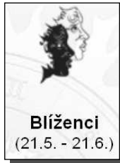
Blíženci (21.5. - 21.6.)

Milí blíženci, týždeň vám prinesie samé zvláštnosti príjemnejšieho typu a charakteru. Veľkou zaujímavosťou je to, že ste si až k dnešným dňom prešli všetkými rázcestiami, na ktorých z vašej strany vždy spadla pri volení smeru správna voľba. Teraz práve naopak, z akéhosi rázcestia prichádzate do bodu, kde sa viacero ciest zlieva do jednej a spoločnej, preto už nepadnú žiadne rozhodnutia, voľby, jednoducho sa rozhodne za vás, čo vy v skutku potrebujete. To, že zrazu nemáte na výber z viacerých možností, je pre vás na tieto dni ideálne a vhodné, preto sa s tým stotožnite. Menšia nepríjemnosť vyskočí v prípade zdravia, nebojte sa a riešte ju.