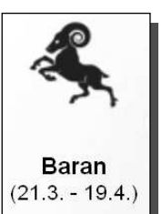
Baran (21.3. - 19.4.)

Nuž, vybrali ste si jednu z tých zložitejších životných ciest a nemali by ste si to vôbec vyčítat. Cesta je síce náročná, ale na jej konci vás čaká presne to, po čom túžite a vy to viete. Viac by ste sa mali sústrediť na všetko, čo robíte a nerobiť to len automaticky, predídete tak menším komplikáciami. V partnerstvách, a všeobecne vo vzťahoch, by ste sa nemali zahrávať s citmi iných, lebo v konečnom dôsledku jediný, kto bude plakať, budete práve vy a to predsa nechcete. Vo vzťahoch ešte v jednej záležitosti zostaneme – pribrzdíte s umelým budovaním autority a sondovania, kto z vás dvoch má navrch. V zdravotnej sfére buďte obozretní, sústredení a predvídajú hlavne na cestách a pri pohybe.