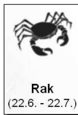
Rak (22.6. - 22.7.)

Pre vaše znamenie prichádza ustálenosť a stabilizovanie, aspoň pre tento týždeň. Odporúčaná máte pozvoľné tempo a nevybočovanie z vami stanovených ciest. Po tieto dni sa vám v žiadnom smere nevypláti riskovať a už vôbec nie v prípade peňazí, ktoré by ste si mali nielen väziť, ale aj strážiť. Keď sa pokúsíte (v tomto prípade aj silene) usmievať na svet, tak aj svet sa bude usmievať na vás a všetko bude o čosi krajšie. To, že sa budete v tomto čase a v určitých situáciách častejšie a citelne vnímať v pozícii podriadeného, môže spôsobiť váš výbuch, preto to chce kontrolu a spomenuté nevybočovanie.