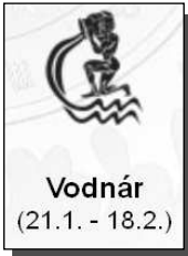
Vodnár (21.1. - 18.2.)

Akejkol'vek cesty, ktorá vás čaká a ktorú si dôkladne naplánujete, sa vôbec nemusíte obávať. Pôjdete smerom k teplu, pochopeniu a slnku, takže naozaj, nech je jej cieľom čokoľvek, zahodíte pocity akýkoľvek obáv. V tomto prípade však očakávajte, že jedna zmena predsa len nastane, pokiaľ ste cestu plánovali ako jednotlivec, tak tento fakt sa zmení a absolvujete ju minimálne dvaja a s tým by ste vopred mali rátať. Trochu viac by ste však mali dbať na svoje zdravie a to hlavne v prípade vyčerpanosti a neovládateľnej únavy, s tým naozaj treba niečo robiť. Ponatahovať by ste si mali aj stuhnuté svalstvo.