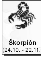
Škorpión (24.10. - 22.11.)

Áno, presne tak, aj na vás sa usmieva prísľub hojnosti a zdaru, ktorý vás bude sprevádzať každý deň tohto týždňa. Ani nebudete vedieť ako, vlastne to nie je ani dôležité, ale v každom smere sa vám bude dariť, svoju úlohu zohrá aj fakt, že ste si vypracovali v sebe imunitu na nezdary a problémy – prijali ste ich a práve preto sa karta otočí a vám pôjde úplne všetko hladko. Ideálne by bolo využiť to, hlavne na doriešenie medziludských vzťahov, kde sa nejaké väzby narušili, tak sa ich pokúste opraviť. Možno o niečo viac pocítite deficit slnka a svetla, čo sa podpíše aj na vašej nálade, vykompenzujte si to kúpelom, návštevou sauny a podobne.