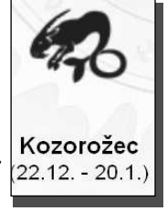
Kozorožec (22.12. - 20.1.)