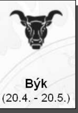
Býk (20.4. - 20.5.)

Veci, ktoré ste si zanedbali, budete musieť veľmi rýchlo dobehnúť, aspoň to by bolo to správne odporúčenie. Po smutnejších dňoch príde ďalšie štádium, v ktorom sa znovu nabudíte a tak bude môcť len a len napredovať. Zamávať však môže vami chuť a tendencia sťažovať sa všade, kam vkročíte a kde sa ocitnete, zamyslite sa nad tým, je to naozaj nutné? Sústredte sa radšej na príjemnejšie stránky života, ktoré vás budú posilňovať a nie vás tahat' k povrchnosti a niekam až tam dolu. Ale, aby to nebolo len o tých nepríjemnejších záležitostiach, ku koncu týždňa sa môžete tešiť na menšie prekvapenie.